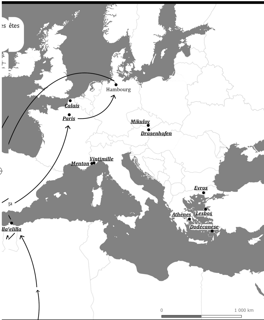
Carte générale (Camille Guenebeaud)